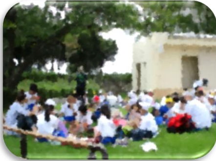
全校 なかよし遠足