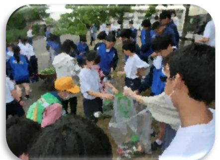
クリーン作戦 (7月・10月)