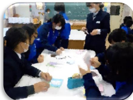
友愛訪問 (マスク作り)