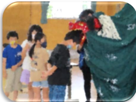
3年生 木崎地域の学習