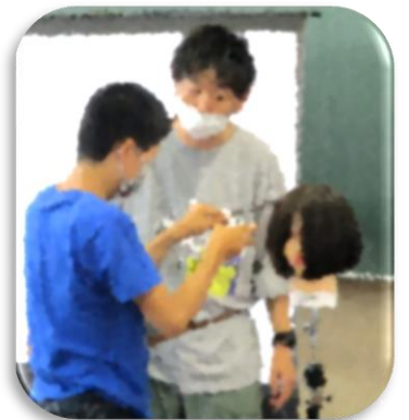
6年生 キャリア教育